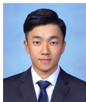
윤춘호 책임 Thermo Fisher Scientific